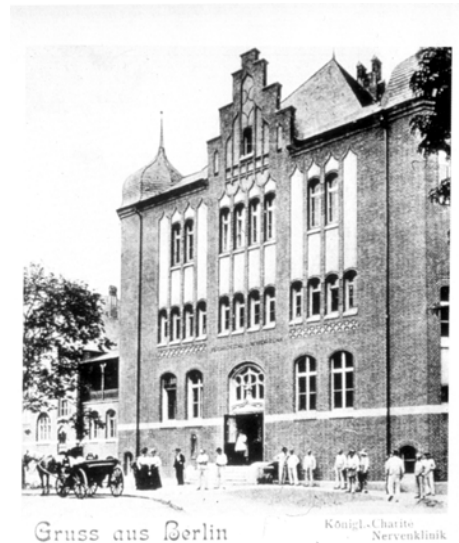
Gruss aus Berlin