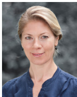
Dike Remstedt Ambulanz-Managerin/ Studienassistentin